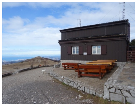
SLAVNIK IN GRMADA